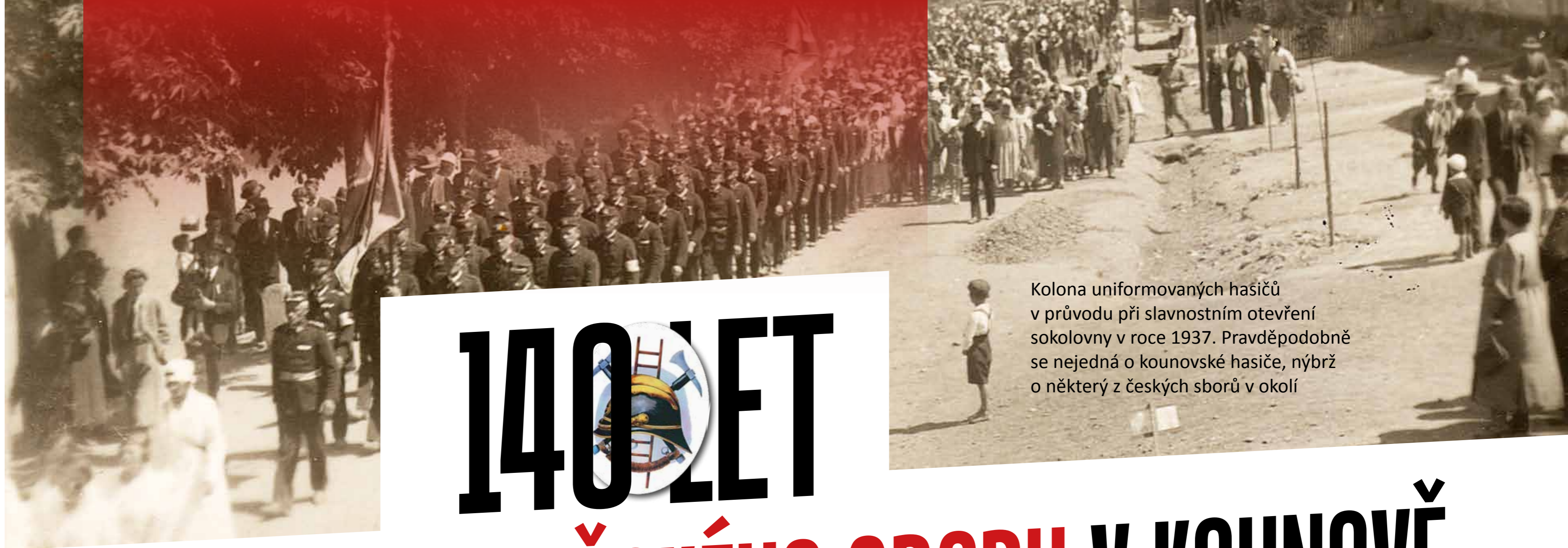
Kolona uniformovaných hasičů v průvodu při slavnostním otevření sokolovny v roce 1937. Pravděpodobně se nejedná o kounovské hasiče, nýbrž o některý z českých sborů v okolí