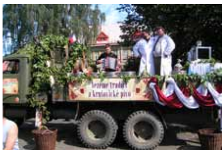
Pojízdný výčep v Kounově.

V naší obci se ani přes nasazení elitní úderné jednotky nepodařilo zdolat přidělených sto piv! Okolní obce měly daleko lepší skóre.