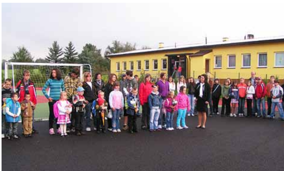
Zahájení nového školního roku v Základní a mateřské škole. Informace z činnosti ZŠ a MŠ Kounov naleznete na třetí straně občasníku.