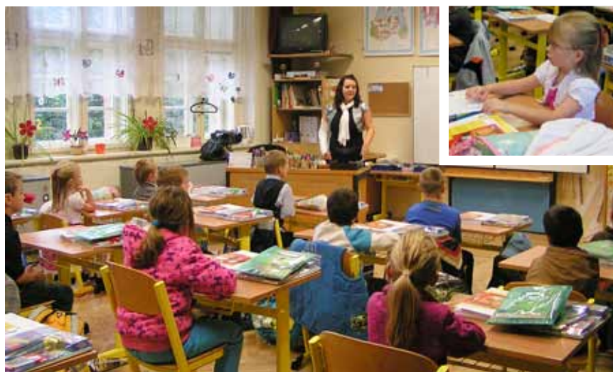
První den v první třídě.